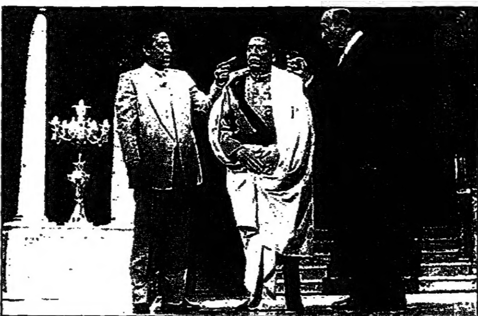
في مشهد من مسرحية «الزعيم»